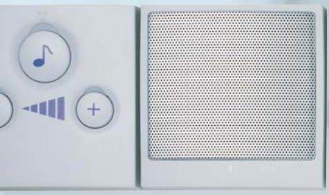
Sélecteur de canal radio et du volume sonore pour diffusion de musique avec phonie