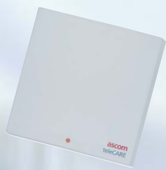
Unité avec prise pour manipulateur