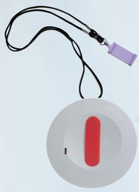
Emetteur médaillon UHF avec cordon et clips de fixation