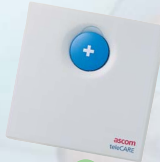
Unité d'appel spécifique