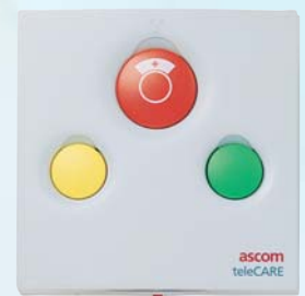
Tirette d'appel pour patient, Annulation d'appel, Appel d'urgence et Présence 1, Assistance ou Présence 2