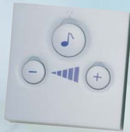
Sélecteur de diffusion de musique