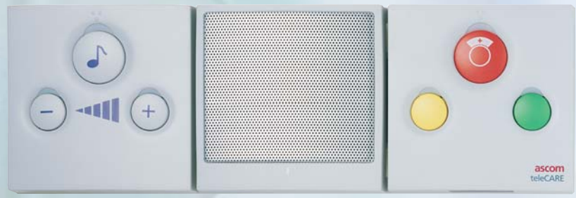
Unité d'appel pour patient avec phonie, Sélecteur de canal radio et du volume sonore pour diffusion de musique, Annulation d'appel, Appel d'urgence et Assistance