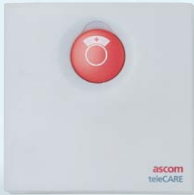
Unité d'appel pour patient