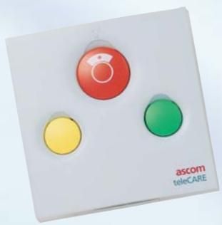
Unité d'appel pour patient, annulation d'appel, Appel d'urgence et Présence 1, Assistance ou Présence 2