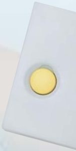
Unité d'annulation d'appel, Appel d'urgence et Présence 1