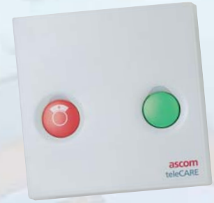
Unité d'appel pour patient, Annulation d'appel, Appel d'urgence et Présence 1