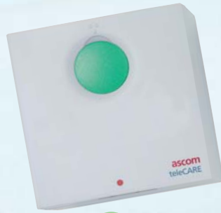
Unité d'annulation d'appel, Appel d'urgence et Présence 1