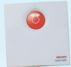
Tirette d'appel pour patient