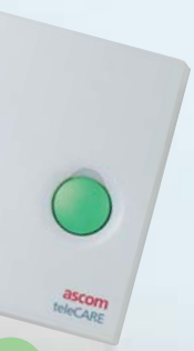
Unité d'appel, annulation d'appel, Appel d'urgence et Présence 1, Assistance ou Présence 2