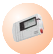
Radiomessagerie teleCOURIER 900