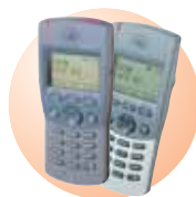
Téléphonie mobile Radiomessagerie Dispositif de protection du personnel de soins Ascom 9d