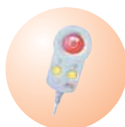
Appel Infirmières teleCARE