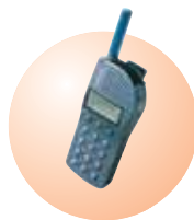
Dispositif de protection du personnel de soins telePROTECT 900